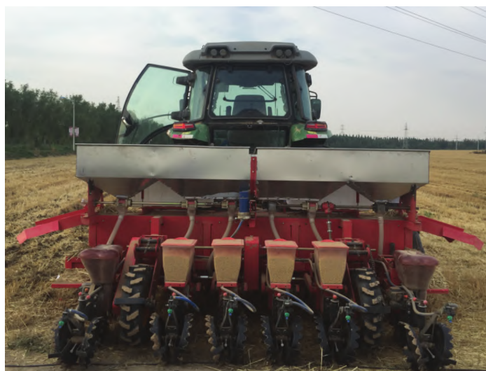
图 2 2BMF-6 型玉米-大豆免耕覆秸精量播种施肥机

2.2.1 机械播种。在选种、晒种的基础上,选用行株距满足农艺要求的大豆-玉米带状复合种植施肥播种一体机,如 2BMF-6 型玉米-大豆免耕覆秸精量播种施肥机,实现种肥同播、种床整备、侧深施肥、精量播种、覆土镇压、喷施封闭除草剂和秸秆均匀覆盖等作业目标。其整机结构如图 2 所示,主要由机架、驱动装置、肥料箱、玉米株(穴)距调节装置、大豆株(穴)距调节装置、玉米播种单体和大豆播种单体组成。驱动装置和播种单体安装于机架后梁上,中部 4 个单体为大豆播种单体,两侧单体为玉米播种单体,肥料箱安装于机架正上方 [2] 。调节播种深度相关零部件,确保玉米和大豆播种深度分别控制在 3~5、2~3 cm。也可选择技术参数达到表 1 要求的当地的玉米、大豆播种机具。