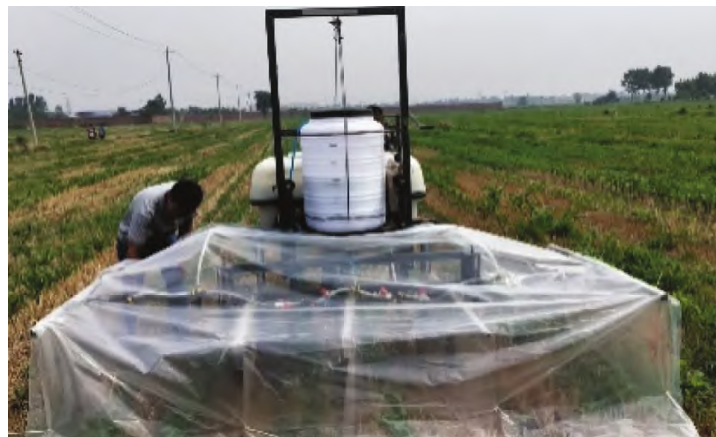
图4 自制的分带喷雾植保机具

带和玉米带间加装隔离板,强化带间隔离,确保定向喷雾效果,防止漂移药害发生(图4)。