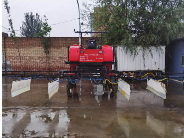
图3 3WPZ-1000高地隙自走式喷杆喷雾机