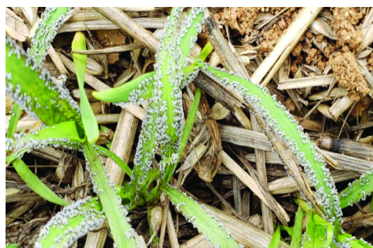
图2 谷子侵染病菌 1~2 d后田间表现症状