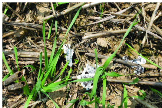
图3 谷子侵染病菌 3~5 d后田间表现症状